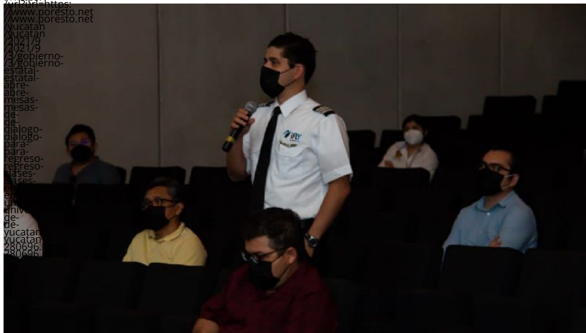
Los representantes de escuelas de nivel superior expresaron sus dudas sobre este regreso a clases .

(/u/fotografias/fotosnoticias/2021/9/3/123997.jpeg)