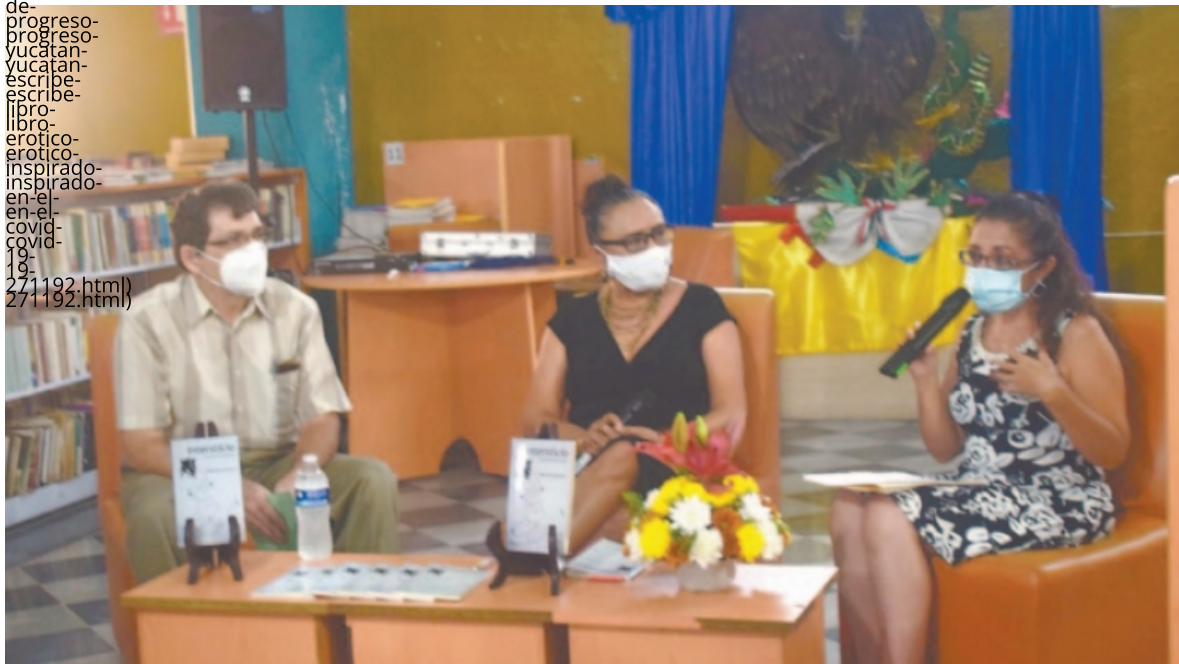
(La escritora mencionó que la estructura de este proyecto rompe esquemas, ya que tiene referencias eróticas. Foto: Jesus Lopez (ufotografias/fotosnoticias/2021/8/6/112214.png)

(https://telegram.me/share/url? ://https://www.poresto.net/unicornio/cultura/2021/8/6/poeta- url=https://www.poresto.net/unicornio/cultura/2021/8/6/poeta-