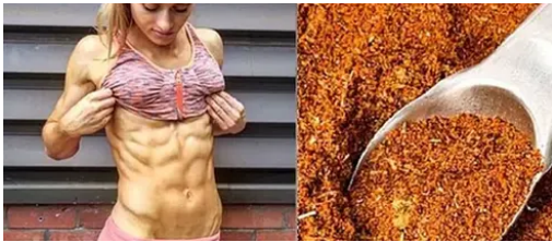
Una cuchara en ayunas quema 10 kg de grasa en 5 días