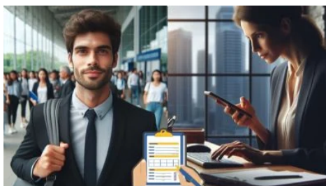
Requisitos para trabajar en consulado de EU en Guadalajara; pagan más de 22,000 al mes