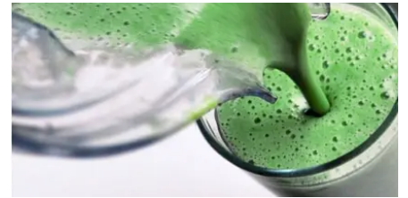
Limpia tus venas con esta receta y recupera 30 años de tu vida