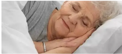
5 señales de que una persona morirá en 2-3 días: recuérdalo