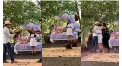
Pareja revela sexo de bebé con pelea de gallos y genera debate en redes sociales