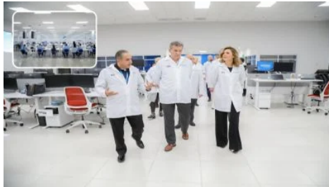
Se consolida Baja California como líder nacional en la industria de exportación