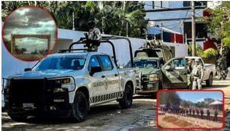
"Tenía mi parcela, un día llegó gente armada y me pidió vendérsela": Nuevo cártel en Chiapas genera terror