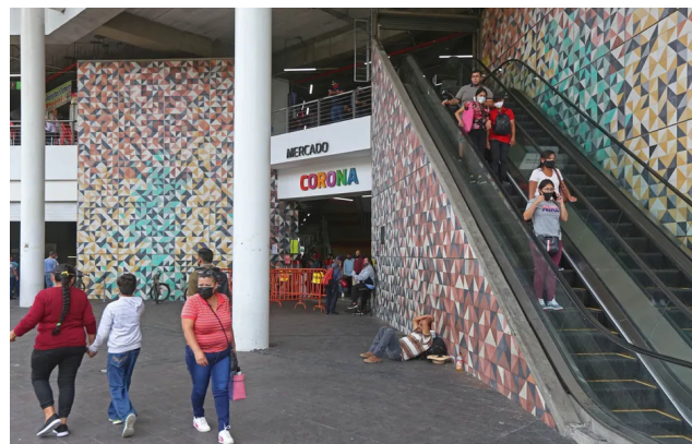
Mercado Corona en Guadalajara (Fernando Carranza)

A partir del viernes 30 de octubre corren los 14 días con cierres parciales en diferentes giros y actividades del estado.