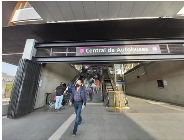
El transporte público dará servicio a ciertos trabajadores de giros esenciales (Rosario Álvarez)

Las empresas de redes de transporte o de plataforma podrán operar de lunes a viernes entre 5:30 y 20:59 horas. Sábados y domingos de 7:00 a 14:00 horas.