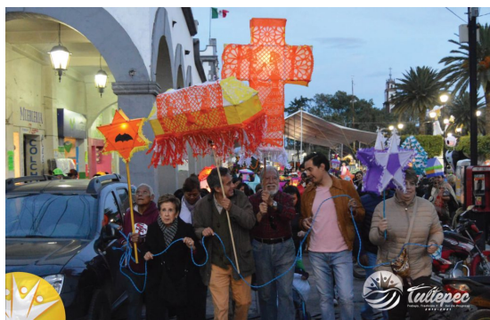
( http://tultepec.gob.mx/wp-content/uploads/2020/10/faroles2.jpg )

De esta forma, la suma de voluntades del gobierno municipal y de los continuadores de esta genuina expresión tultepequense buscan preservar y difundir el Paseo de Los Muertitos , es un compromiso de la administración 2019-2021, por mantener este legado para las generaciones futuras, a la cual, cada año se suman más participantes locales y de municipios circunvecinos.