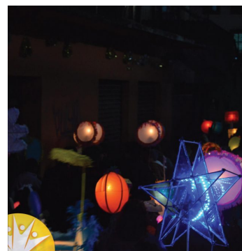
( http://tultepec.gob.mx/wp-content/uploads/2020/10/faroles1.jpg )

TAGS : DÍA DE MUERTOS FAROLITOS PASEO DE LOS MUERTITOS TULTEPEC