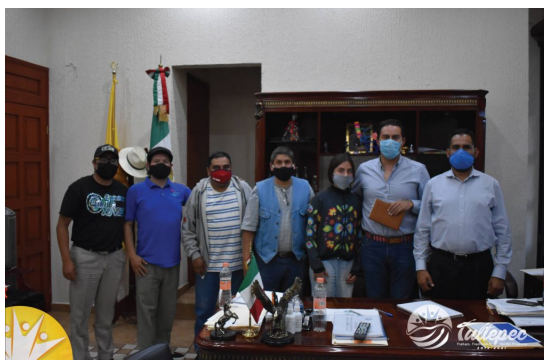
( http://tultepec.gob.mx/wp-content/uploads/2020/10/faroles4.jpg )