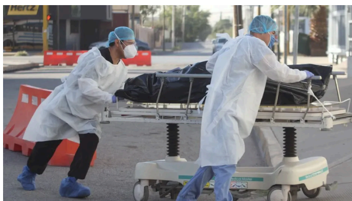
El primer deceso en México por el virus ocurrió el pasado mes de marzo.

El 18 de marzo de este año murió la primera persona en México por covid-19. A 8 meses del suceso y con más de 100 mil fallecimientos debido al virus, vale la pena recordar a quien tristemente comenzó el conteo.