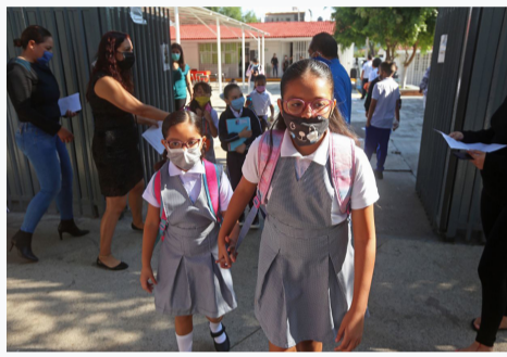
El 7 de junio se reabren las escuelas en CDMX