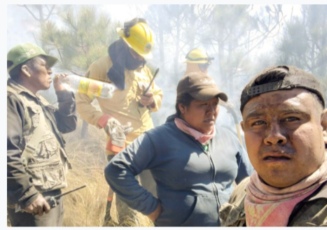
Los nuevos comuneros de Milpa Alta: contra la tala y los partidos