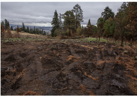
Talan bosque con apoyo de alcaldesa que busca reelegirse