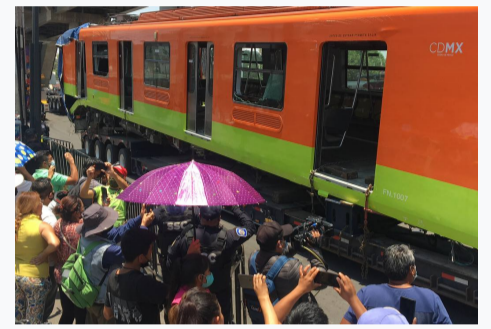
Enojo y desconsuelo en Tláhuac